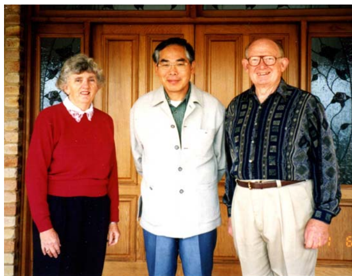
Lismore : 1泊2日