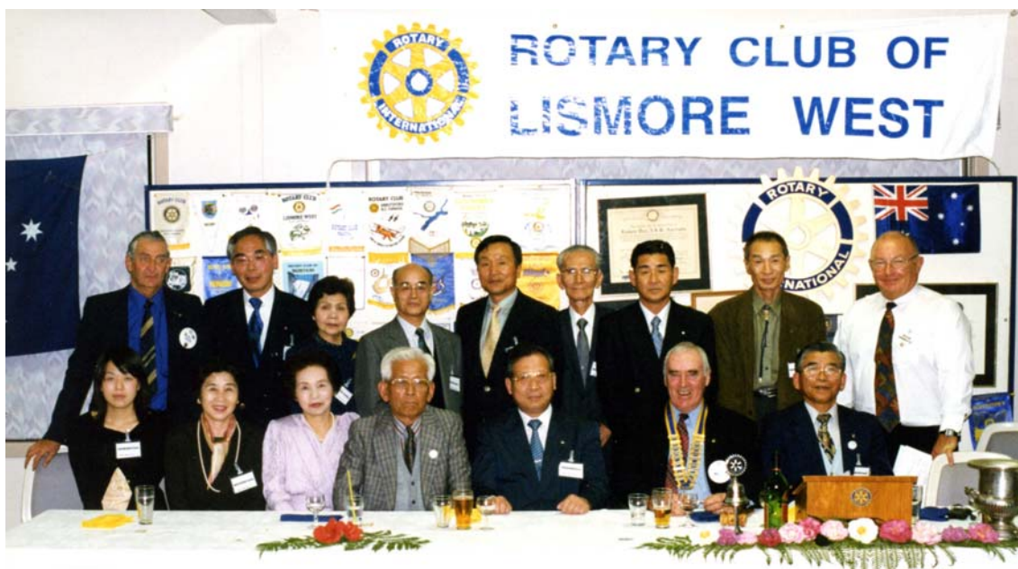
1999/June.8th Lismore-West RC 例会場(訪問者全員)